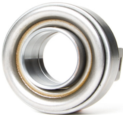
Photo 1: Les butées équipées d'une douille en métal doivent être graissées