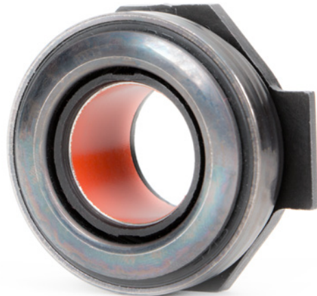
Photo 3 : Ne jamais graisser les butées équipées d'une douille revêtue de PTFE

Respecter les préconisations du constructeur du véhicule!