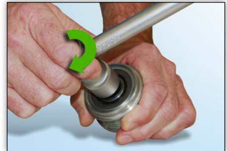
Photo 5 : Dans le sens des aiguilles d'une montre, l'outil tourne sans problème avec une légère résistance.