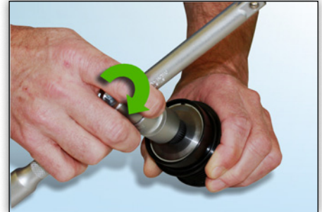
Photo 7 : Dans le sens des aiguilles d'une montre, l'outil tourne sans problème avec une légère résistance.

Vous trouverez les pièces de rechange INA correspondantes dans notre catalogue en ligne à l'adresse www.Schaeffler-Aftermarket.com ou sur RepXpert à l'adresse www.RepXpert.com .