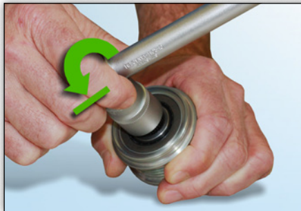
Photo 4 : Il est impossible de tourner l'outil dans le sens inverse des aiguilles d'une montre ; il se bloque immédiatement.