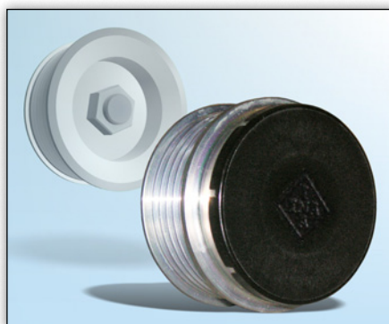
Photo 2 : Pour protéger les OAP et OAD contre les saletés, il est indispensable d'y poser un capuchon de protection.

Une fois montée, il est difficile de s'assurer du bon fonctionnement de la poulie à roue libre. Il est donc recommandé de la démonter pour en vérifier l'état.