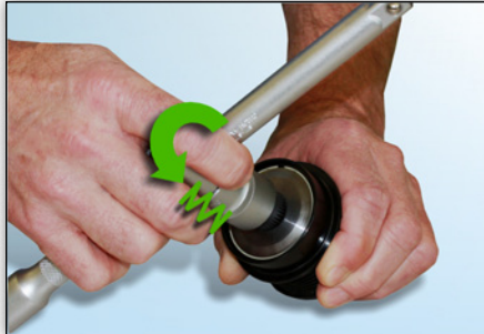
Photo 6 : Dans le sens inverse des aiguilles d'une montre, la résistance opposée augmente très rapidement.