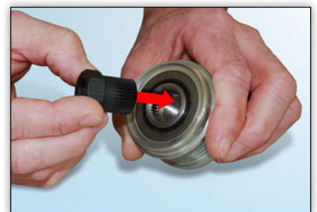
Photo 3 : Insérer l'adaptateur approprié dans la poulie à roue libre d'alternateur.

Pour démonter et/ou vérifier les OAP et OAD, il faut choisir dans la mallette l'adaptateur approprié.